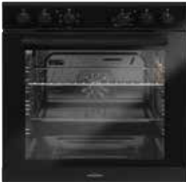
Backofentürgriff schwarz pureBLACK (gegen Aufpreis)