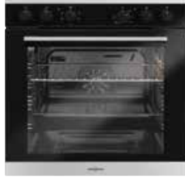
EBH 9913, Ausführung Edelstahl