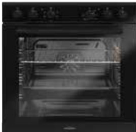
Backofentürgriff schwarz pureBLACK (gegen Aufpreis)