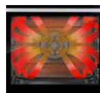
4-Stream-Technologie für 6 Einschubebenen