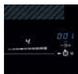
Übersichtlich: Slider-LED weiß, Timer-LED blau