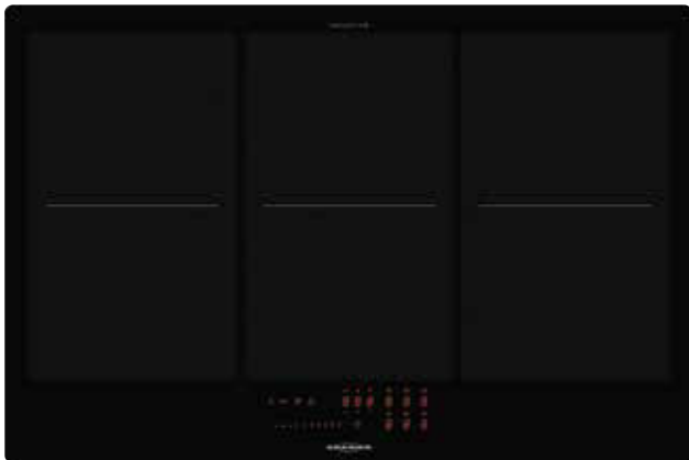
FLI 2086 SL