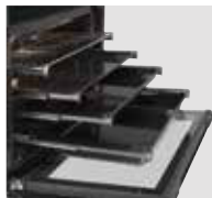
Großer Backraum mit 9 Einschubebenen kann mit bis zu 4 Vollauszügen ausgestattet werden.