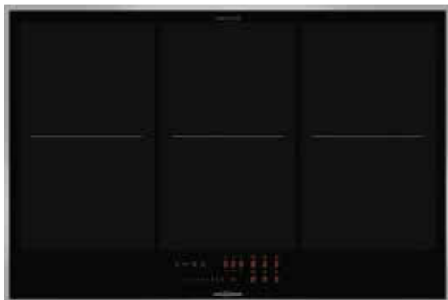
FLI 2086 SL mit umlaufendem Edelstahlrahmen (Sonderzubehör)