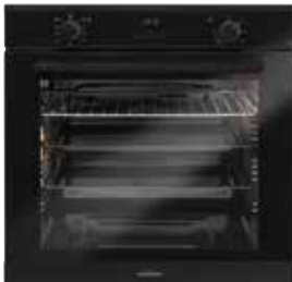
Backofentürgriff schwarz pureBLACK (gegen Aufpreis)