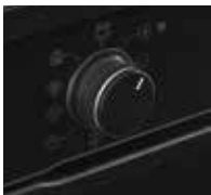
Versenkbare Knebel mit Index und Ring beleuchtet