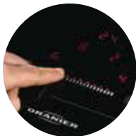
Übersichtlich: Slider-Bedienung mit Brückenfunktion