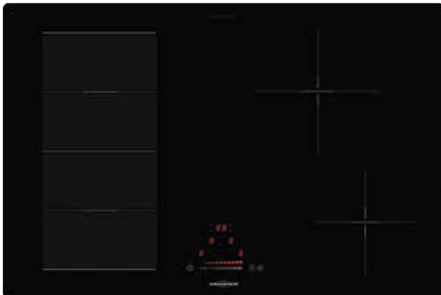
KXI 2081 SL