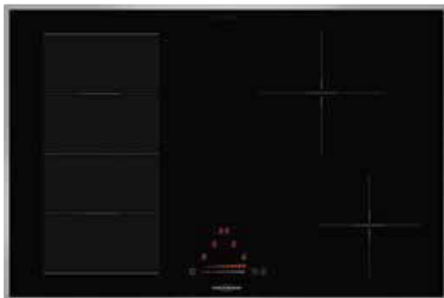
KXI 2081 SL mit umlaufendem Edelstahlrahmen (Sonderzubehör)