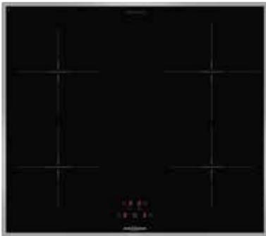
KFI 9962 TC mit umlaufendem Edelstahlrahmen (Sonderzubehör)