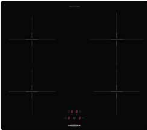
KFI 9962 TC