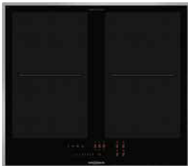
FLI 2064 SL mit umlaufendem Edelstahlrahmen (Sonderzubehör)