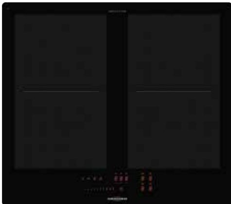
FLI 2064 SL