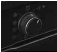
Versenkbare Knebel mit Index und Ring beleuchtet