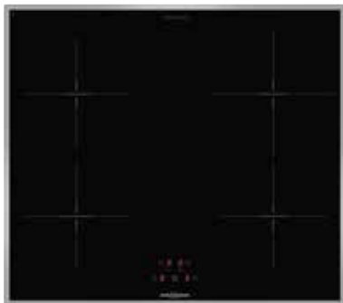
KFI 9962 TC mit umlaufendem Edelstahlrahmen (Sonderzubehör)