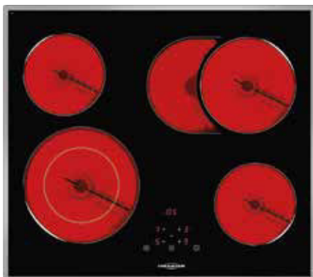
KFTC 9965 TC mit umlaufendem Edelstahlrahmen (Sonderzubehör)