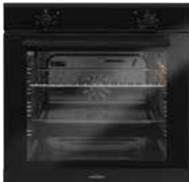
Backofentürgriff schwarz pureBLACK (gegen Aufpreis)