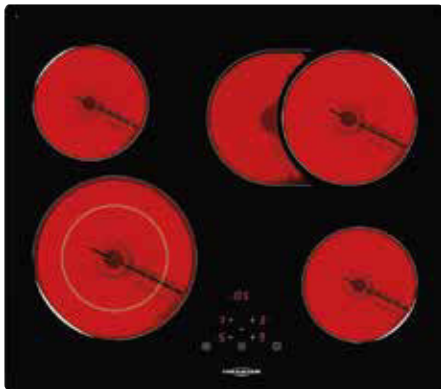
KFTC 9965 TC