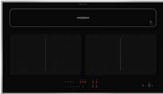
KFL 2092 SL mit geschlossener Absaugklappe und Edelstahl-Seitenleisten (Sonderzubehör)