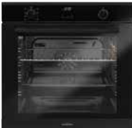
Backofentürgriff schwarz pureBLACK (gegen Aufpreis)