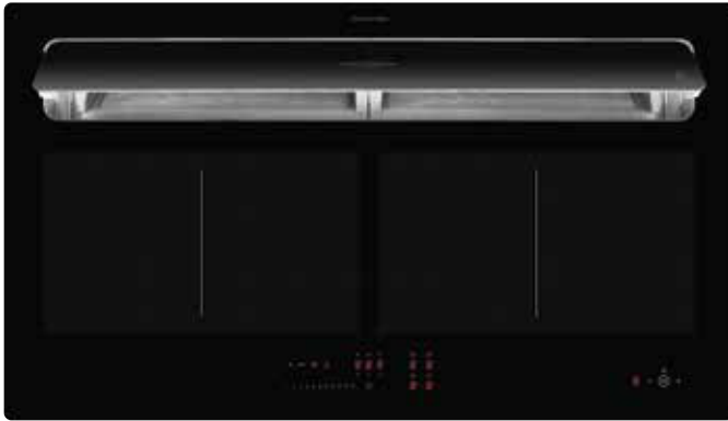
KFL 2092 SL mit offener Absaugklappe