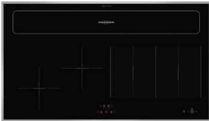
KXI 1092 TC mit geschlossener Absaugklappe und umlaufenden Edelstahlrahmen (Sonderzubehör)