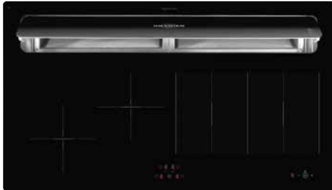
KXI 1092 TC mit offener Absaugklappe