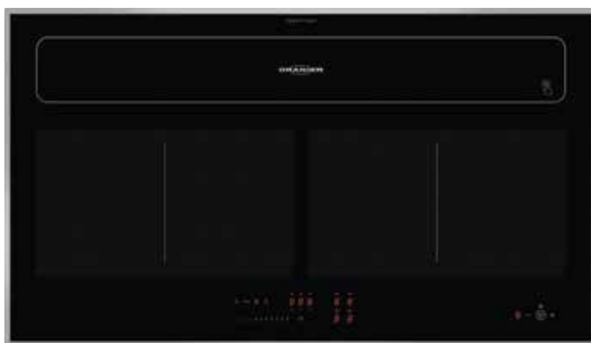
KFL 2092 SL mit geschlossener Absaugklappe und Edelstahl-Seitenleisten (Sonderzubehör)