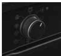
Versenkbare Knebel mit Index und Ring beleuchtet