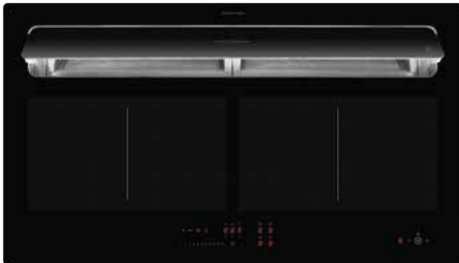
KFL 2092 SL mit offener Absaugklappe