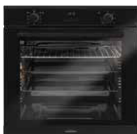
Backofentürgriff schwarz pureBLACK (gegen Aufpreis)