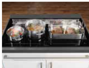
KXI 1092 TC mit Bräter und 2 Töpfen