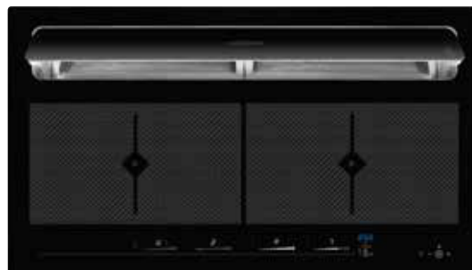
KFL 2094 bc mit offener Absaugklappe