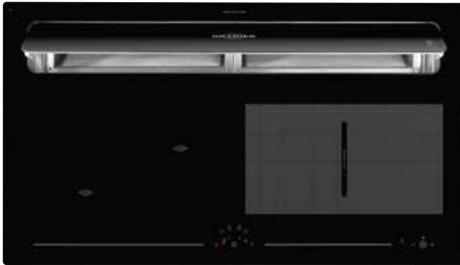
KXI 1092 mit offener Absaugklappe