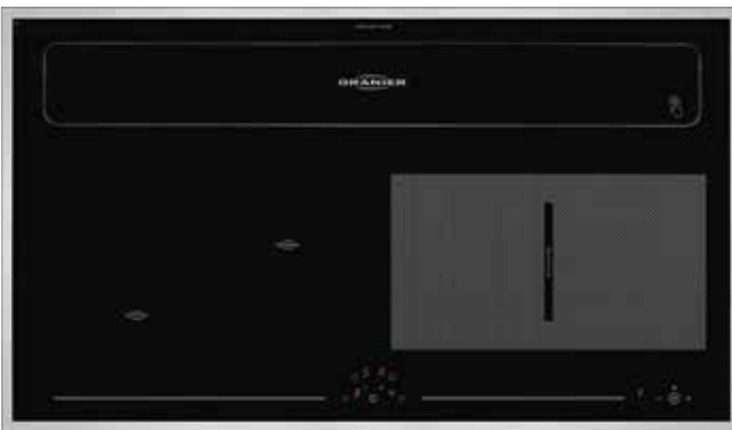
KXI 1092 mit geschlossener Absaugklappe und umlaufenden Edelstahlrahmen (Sonderzubehör)