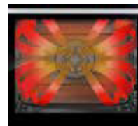
4-Stream-Technologie für 6 Einschubebenen