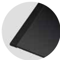
Seitenleisten schwarz pureBLACK (Sonderzubehör)