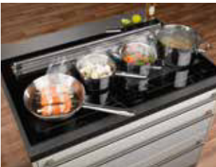
KXI 1092 mit Pfanne und 3 Töpfen