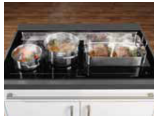
KXI 1092 mit Bräter und 2 Töpfen