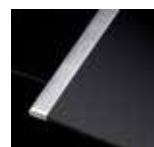
Übersichtlich: Mono-Slider mit Brückenfunktion Edelstahl-Seitenleisten (Sonderzubehör)