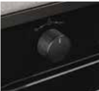
pureBLACK Design-Knebel mit Click&Turn-Bedienung