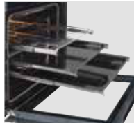
Großer Backraum mit 9 Einschubebenen, kann mit bis zu 4 Vollauszügen ausgestattet werden.