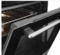
FullClear-Door mit TopCover und ComfortMOVE-Funktion