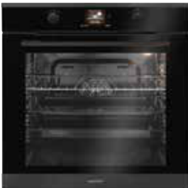
Backofentürgriff schwarz pureBLACK (gegen Aufpreis)