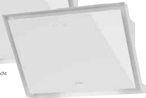
Lara 75 W ohne Schacht