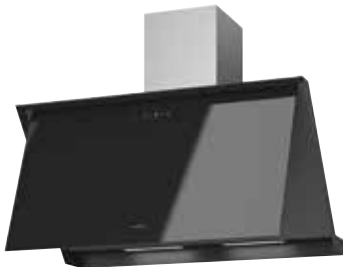
Lara 90 S offen