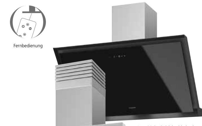
Lara 90 S mit Edelstahlschacht