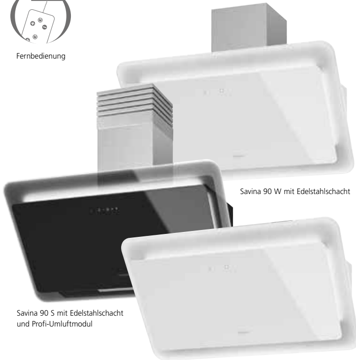
Savina 90 W mit Edelstahlschacht