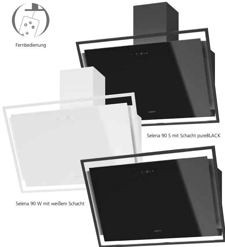
Selena 90 S mit Schacht pureBLACK