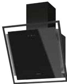
Selena 60 S mit Schacht pureBLACK