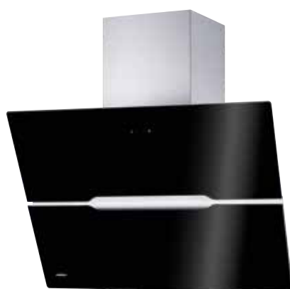
Vivio 90 S mit Edelstahlschacht