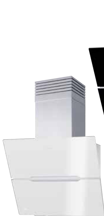
Vivio 75 W mit Edelstahlschacht und Profi-Umluftmodul