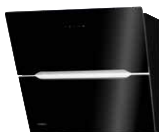
Vivio 60 S ohne Edelstahlschacht