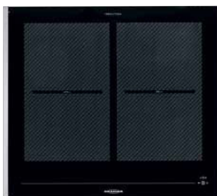
FLI 2068 GRILL mit Edelstahl-Seitenleisten