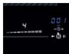
Übersichtlich: Slider-LED Weiß, Timer-LED Blau