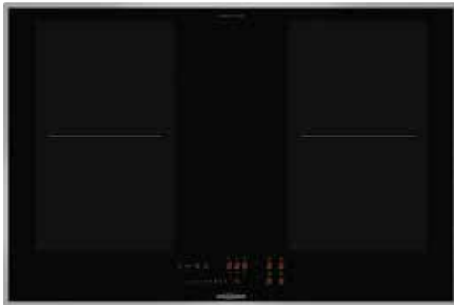
FLI 2084 SL mit umlaufendem Edelstahlrahmen (Sonderzubehör)