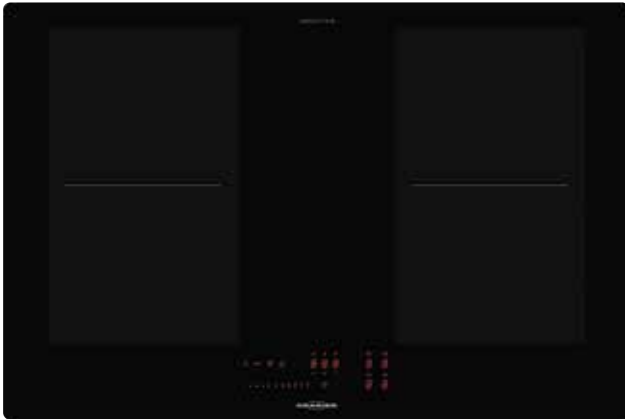
FLI 2084 SL