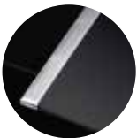
Seitenleisten Edelstahl (Sonderzubehör)