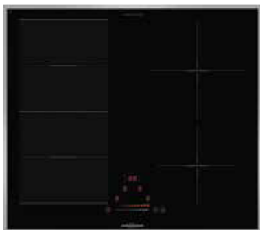
KXI 2062 SL mit umlaufendem Edelstahlrahmen (Sonderzubehör)