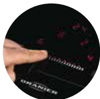
Übersichtlich: Slider-Bedienung mit Brückenfunktion