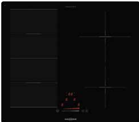
KXI 2062 SL