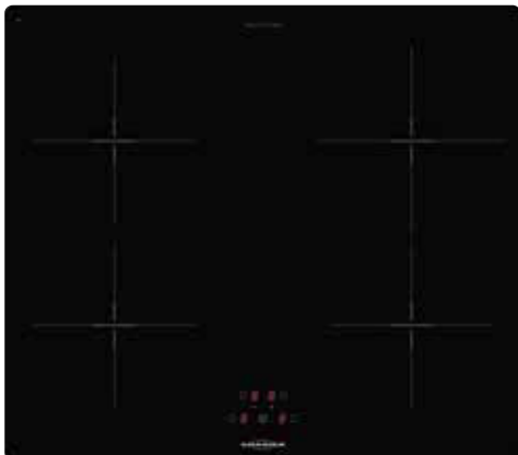
KFI 9962 TC