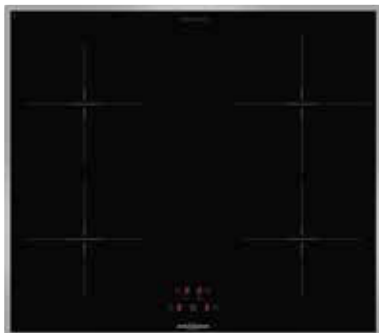
KFI 9962 TC mit umlaufendem Edelstahlrahmen (Sonderzubehör)