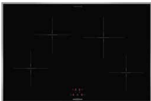
KFI 9981 TC mit umlaufendem Edelstahlrahmen (Sonderzubehör)