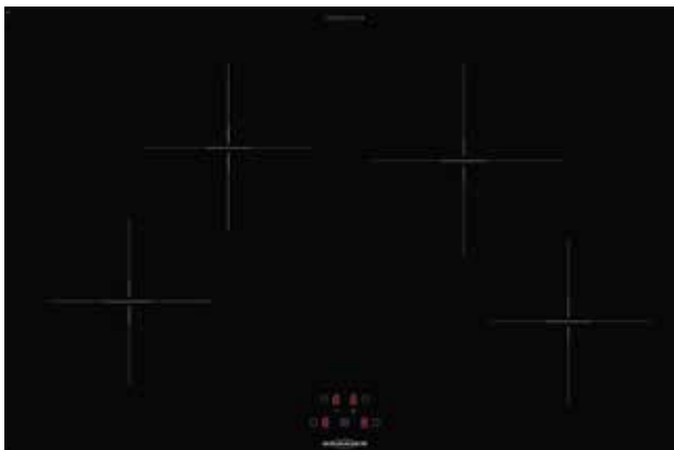
KFI 9981 TC