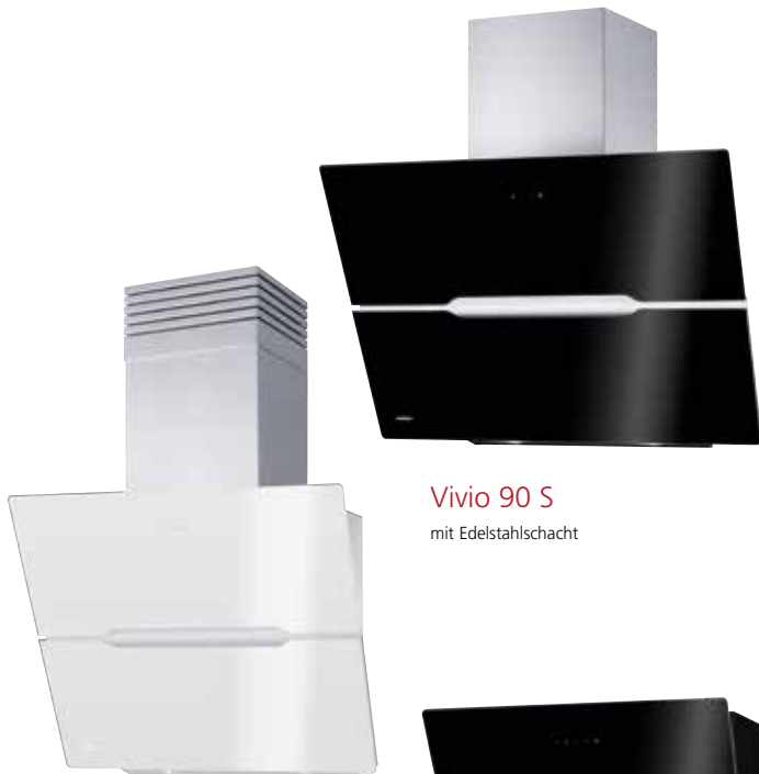
Vivio 90 S mit Edelstahlschacht