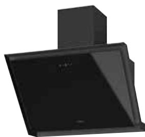
Lara 75 S mit Schacht pureBLACK