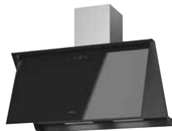
Lara 90 S offen