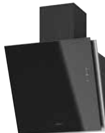
Davara 60 S mit Schacht pureBLACK