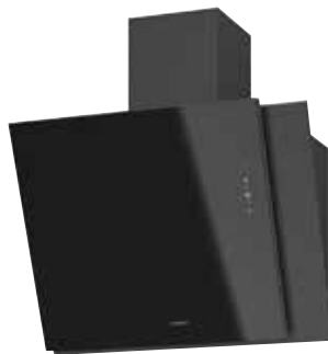
Opal 75 S mit Schacht pureBLACK