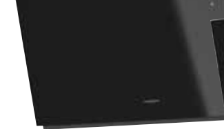
Opal 75 S mit Edelstahlschacht und Profi-Umluftmodul