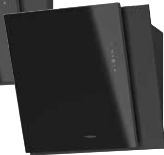
Opal 60 S ohne Edelstahlschacht