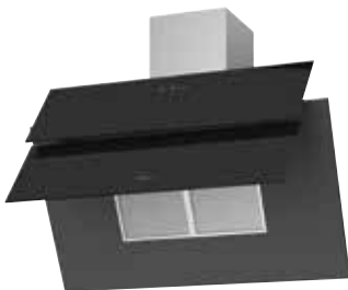
Lito² 90 S offen