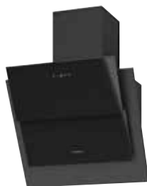
Lito² 60 S mit Schacht pureBLACK