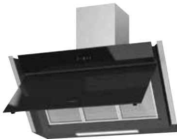
Meba² 90 S offen