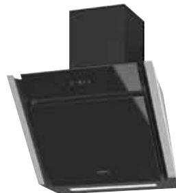
Meba² 60 S mit Schacht pureBLACK