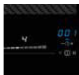
Übersichtlich: Slider-LED weiß, Timer-LED blau