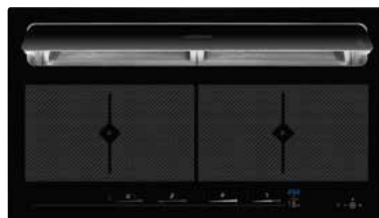
KFL 2094 bc mit offener Absaugklappe