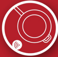
Smartes Kochgeschirr von HESTAN CUE™