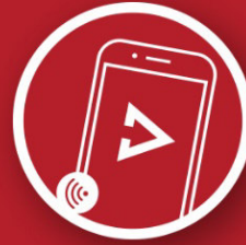
Kostenlose App von HESTAN CUE™