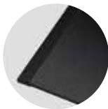
Seitenleisten pureBLACK (Sonderzubehör)