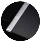
Seitenleisten Edelstahl (Sonderzubehör)