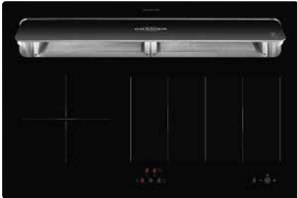
KXI 1082 TC mit offener Absaugklappe