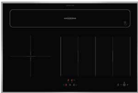
KXI 1082 TC mit geschlossener Absaugklappe und umlaufenden Edelstahlrahmen (Sonderzubehör)